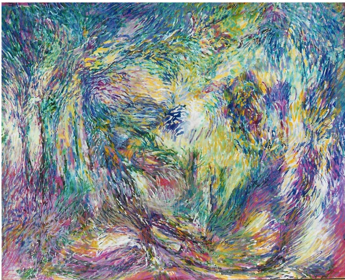
‘Ritmisch Alternatief nr 1’ (acryl op paneel)

Weldra, op vrijdagavond 6 september 2013, brengt hij, in de Oude Schepenbank te Sint-Kwintens-Lennik, een overzichtstentoonstelling die we niet willen missen. In dit unieke kader, gelegen tegenover zijn nu verdwenen geboortehuis, zal Jef alle weekends van september lang, een keuze tonen uit zijn omvangrijk oeuvre. Een uniek kader, maar ook een unieke gelegenheid om een fijnbesnaarde kunstschilder te eren, die dankzij zijn muzikaal talent en zijn stille hartelijkheid bovendien een warme plaats inneemt in onze fanfarefamilie. Men zegge het voort!