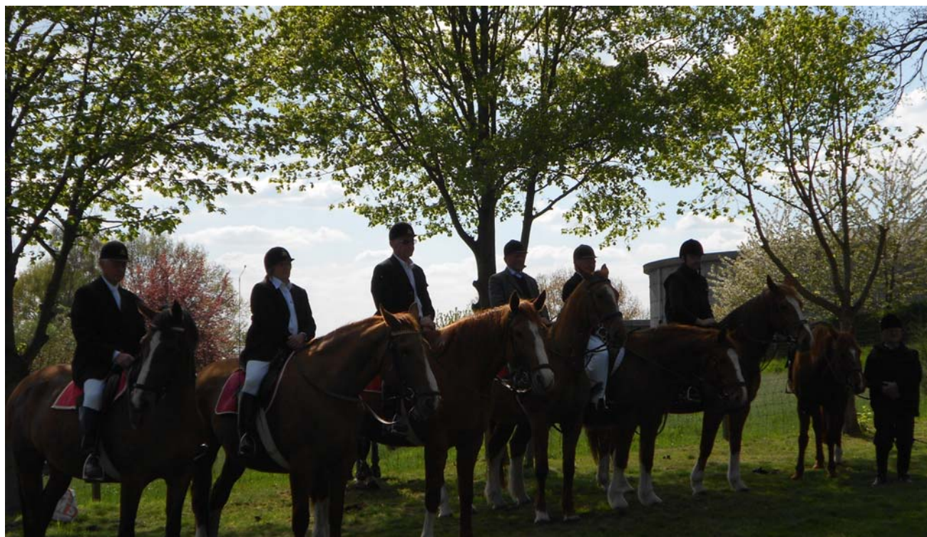
Een stijlvolle escorte voor de Heidetoht op zondag 5 mei 2013

Een achtste jaar al voor onze Naklanken , wat een weelde! Voor 2013 is de steun aan onze Koninklijke Fanfare hernieuwd. Nieuwe steunverleners zijn nog altijd welkom! Ter herinnering: een steunabonnement op Naklanken blijft €5,- kosten, steunende leden schenken €20,- en aan de gulheid van onze sponsors leggen we alleszins geen limieten op. Een gezellige tip: schenk een abonnement aan uw familieleden die Kester hebben verlaten en toch graag nog een Kesterse echo, zij het wat Naklanken , willen horen. Het rekeningnummer vindt men op p.2, compleet met IBAN en BIC-nummer.