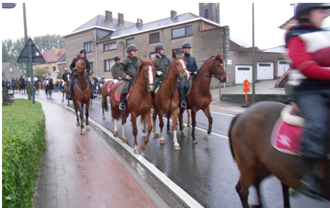
Kermismorgen 2013, 06u15, grijze lucht, glimmende straat... en, op de achtergrond, verregende muziek...

De regengoden zagen in dat zij al voor genoeg kwelling hadden gezorgd, en spraken af dat de lange Weg Om en de latere 'kleine' processietoetocht toch droog zouden kunnen verlopen, de diverse groepen in hun feestelijke gewaden en onze muzikanten, haast voltallig aanwezig, in grote doen!. Waarvoor dank hierboven en hier beneden! Nu kon de kermis echt beginnen, zelfs zonder de traditionele zomerswarme zon!